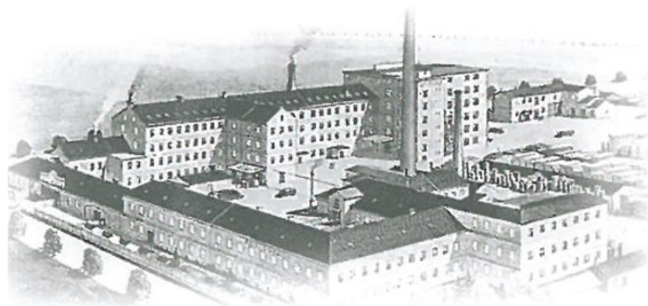
Továrna PETROF v Hradci Králové

Sed daŭris pluajn 8 jarojn, ĝis li ricevis la titolon, post pago de unu mil orajn mone-rojn.