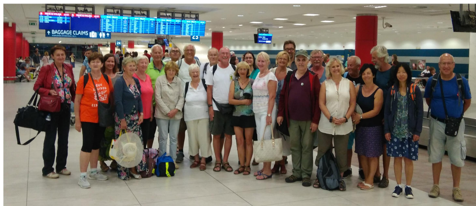
Nia ĉefa grupo en aerodromo