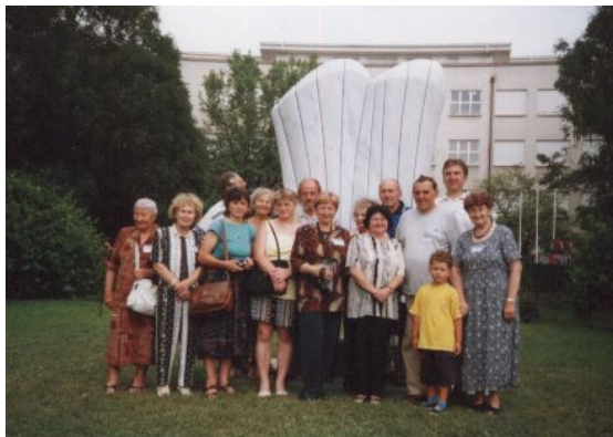
“Pardubická výprava” v Záhřebu

V srpnu 2001 klub, ve spolupráci s AEH, uspořádal autokarový zájezd na 86. světový kongres UEA do chorvatského Záhřebu. Přizvali jsme i zájemce z několika kroužků z celé republiky.