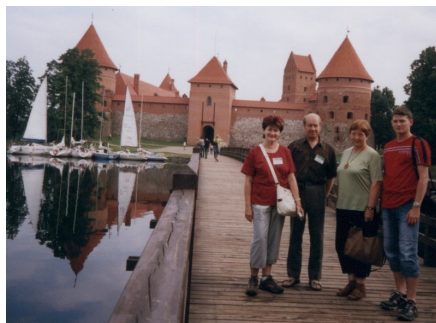
vodní zámek Trakai