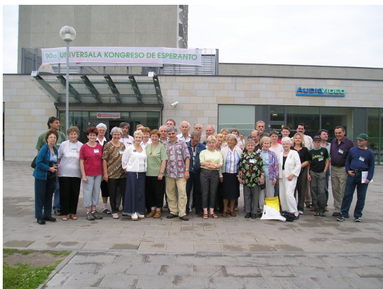
Naše výprava před kongresovou halou.