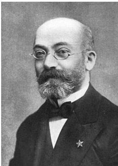
Ludvík Lazar Zamenhof

Jiná situace je dnes. „Vzdorovitá“ mládež, která nerada přijímá vše, co je jí vnucováno, znovu našla esperanto jako prostředek k navazování kontaktů. Především prostřednictvím internetu. Při otevření hesla „esperanto“ zaplesá srdce každého esperantisty.