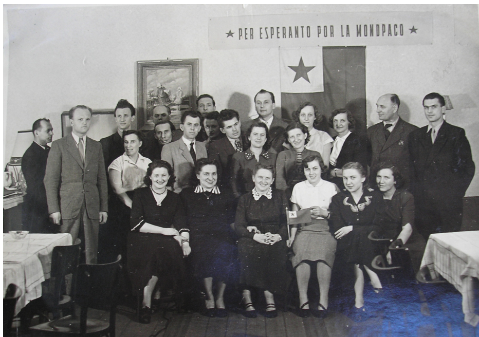
Pardubičtí esperantisté v roce 1953

Pardubický klub navázal družební vztahy s esperantisty z Berlína – Lichtenbergu. Uspořádali mnoho vzájemných návštěv, byly pořádány esperantské bály, společenské, Mikulášské, Schulhofovy a Zamenhofovy večery s bohatým kulturním esperantským programem, společné vyjíždky, a esperantské Silvestry.